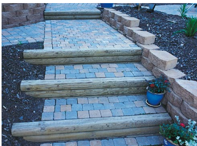
Trappa med Benders Labyrinth antik i kombination med trä.