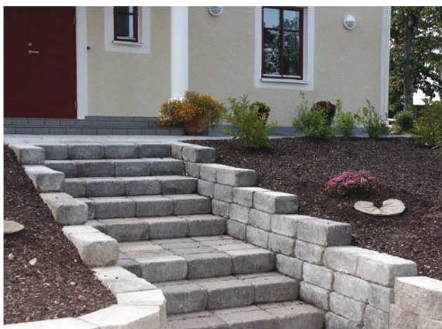
Trappa med Benders Labyrinth antik, mursten.