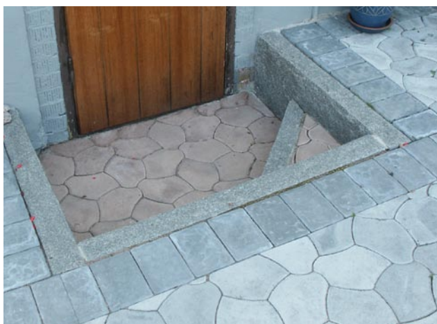
Trappa med granit och Bender Pompeji.