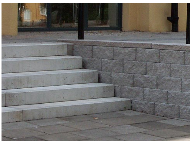
Trappa med Benders Blocksteg vid Benders Megastone mur.