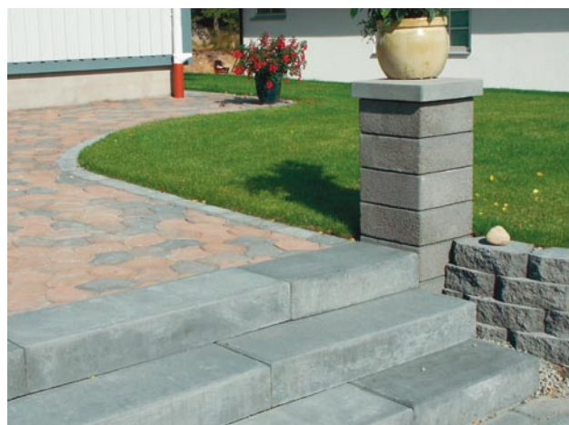
Trappa med Bender Blocksteg