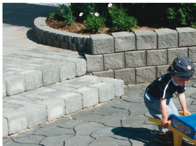
Trappa med Bender Labyrint antik, kantsten och Knott.