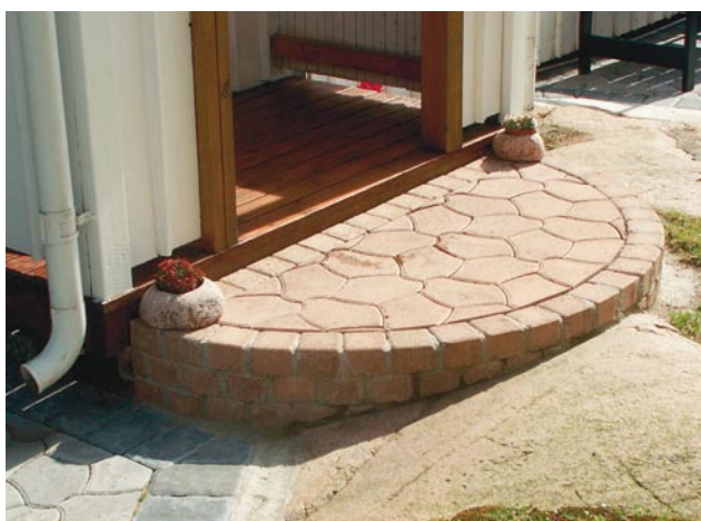
Trappa med Bender Labyrint antik Knott och Bender Pompeji.