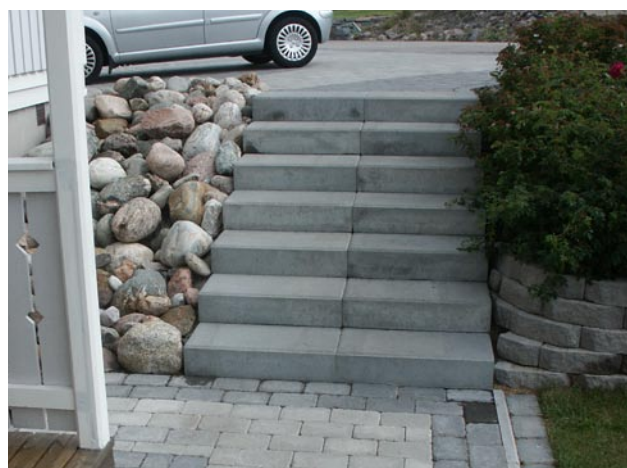
Trappa med Benders Blocksteg.