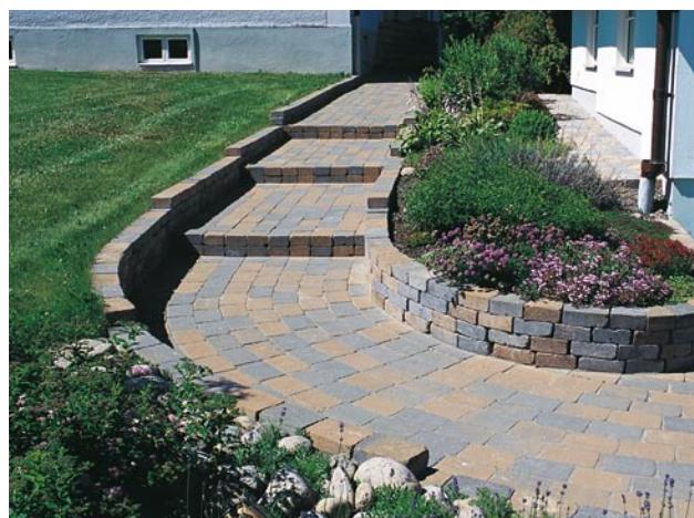
Trappa med Benders Labyrinth antik, helsten.