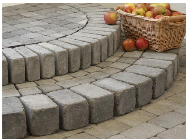
Trappa med Bender Labyrint antik, helsten, kantsten och Knott.