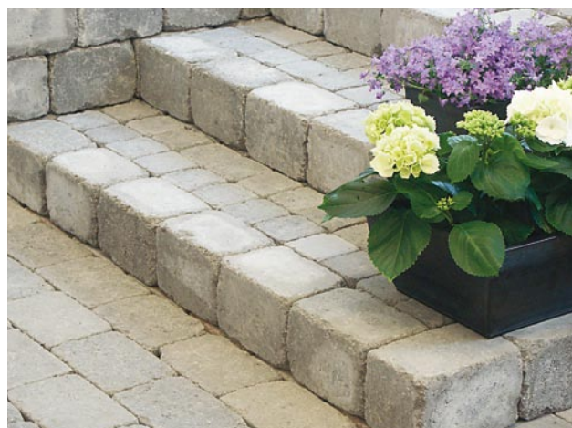
Trappa med Benders Labyrinth antik, kantsten och Knott.